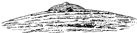
Sl. 25. Gomila blizu Janjine na Pelješcu.

Pitaš li koga, što znači ova gomila, tko ju je sagradio i zašto služi ili je služila, nećeš skoro nikada dobiti točan odgovor. Ili ti reče, da su tu „naši stari“ kamenovali djevojke, kad bi zgriješile, ili da su palili „kralje“ (t. j. poznate ognjeve na sv. Stjepana), ili da su odatle gledali na neprijatelja, kada bi provalio u zemlju. Nu vazda ćeš čuti, da se ništa sigurna o ovim gomilama nezna i da se od najstarijih staraca niko nespominje, kada su bile sagradene. Premda naš narod svrhu ovih gomila ne poznaje, ipak nijesu njegovoj pozornosti mogli izmaknuti tako očevitni i veliki znakovi, pa se po sebi razumije, da je skoro svakoj nadjenuo posebno ime, koje se protieglo na cijeli brežuljak. Neće se